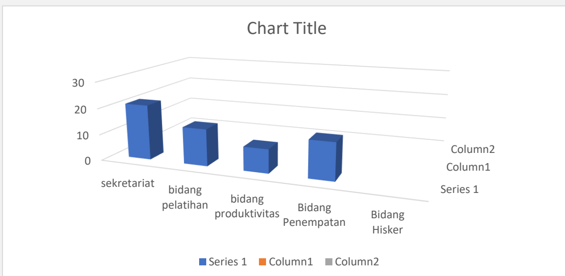
Grafik 3.2. Jumlah Aparatur Dinas Tenaga Kerja Kota Bekasi Tahun 2025

Secara kuantitas, jumlah aparatur Dinas Tenaga Kerja Kota Bekasi saat ini sudah cukup memadai untuk mendukung pelaksanaan program, kegiatan dan sub kegiatan, namun secara kualitas masih diperlukan beberapa orang yang mempunyai keahlian khusus dan kualifikasi pendidikan seperti (1) sarjana informatika terkait (2) Mediator ( Fungsional Perencanaan yang terintegrasi dengan penganggaran sampai dengan monitoring dan evaluasi .